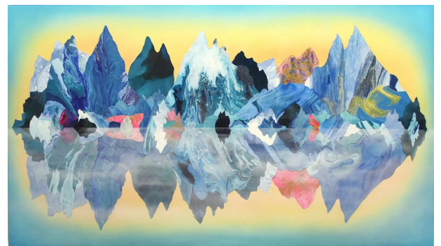
„The Cloud 2019“